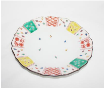
小紋づくし文様六寸皿

毎日お使い頂ける形の鉢です。菊形に沿ってそれぞれ草花の文様、色絵小紋を細かく手描きしております。