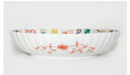
小紋づくし文様九寸楕円菊鉢

径 20.5×25.5×高 6 c m ¥9,000+税 -20% ¥7,200+税