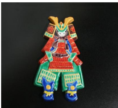
武者陶額 (化粧箱入)