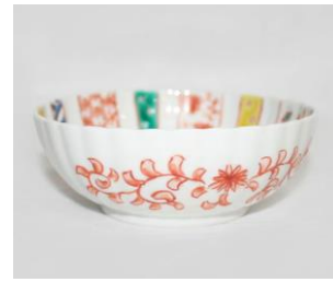
小紋づくし文様四寸菊鉢