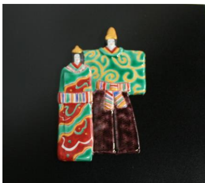
立ち雛陶額 (化粧箱入)

衣桁に着物を掛けて和箆笥と行灯を描いた珍しい図柄の飾り皿です。贈り物にご好評頂いております。