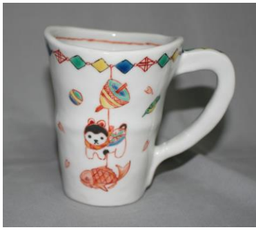
吊り飾文様マグカップ (張子犬)