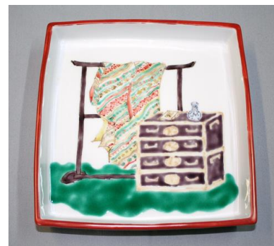
道具づくし文足付六寸皿