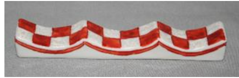
市松文様 (赤) フォーク&ナイフ レスト

各：辺 1.5×6×高 1.5 c m ¥2,500+税 -20% ¥2,000+税