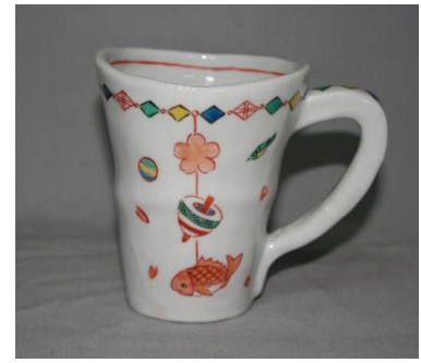
吊り飾文様マグカップ (桜)

各：径 9×12.5×高 11.5 c m (取手含む) ¥6,000+税 -20% ¥4,800+税