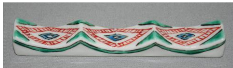
石畳文様 (緑) フォーク&ナイフ レスト

各：辺 1.5×6×高 1.5 c m ¥2,500+税 -20% ¥2,000+税