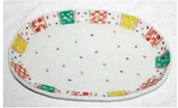
小紋づくし文様尺一楕円皿 (化粧箱入)

デビューした時から人気のお皿です。 使いやすいサイズですので、毎日お使い いただけるお皿です。