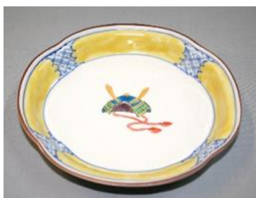
かぶと文様木瓜皿 (皿立付)