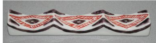
石畳文様 (紫) フォーク&ナイフ レスト

各：辺 1.5×6×高 1.5 c m ¥2,700+税 -20% ¥2,160+税