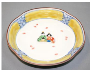
ひな文様木瓜皿 (皿立付)